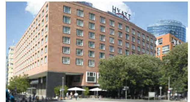
Grand Hyatt Berlin, Marlene-Dietrich-Platz 2

Bitte melden Sie sich mit nebenstehendem Coupon an oder online auf www.haus-und-grund-berlin.de